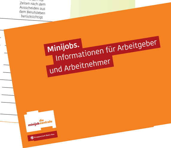
Ausschnitt Broschüre: Minijob – Informationen für Arbeitgeber und Arbeitnehmer

Für bestimmte Personen sollte man weitere Dokumente als Beleg für den Status des Arbeitnehmers einfordern. Diese Dokumente werden insbesondere bei Sozialversicherungsprüfungen relevant.